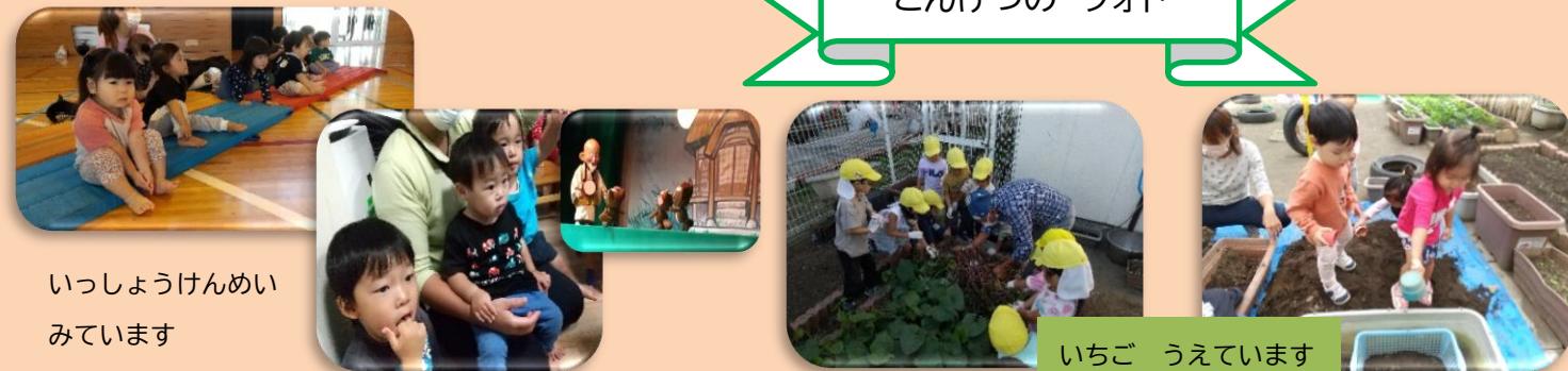
いっしょうけんめい みています