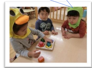
どうやるの？ ともだちの やりかたを よくみて 研究？

どんなおはなし？ ろうそくをかこんで みんなか おはなし しをききました。 (アドベント 礼拝)