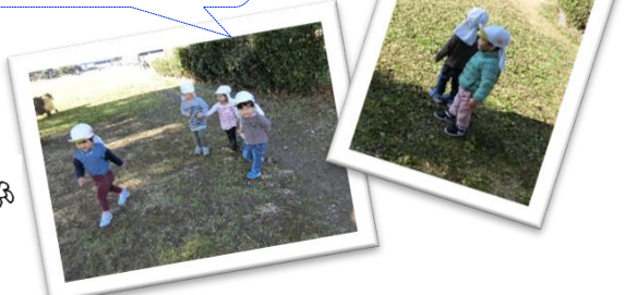
こうえんで ともだちと いっしょ