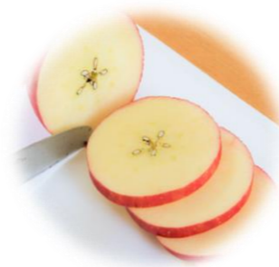
りんごのスターカット