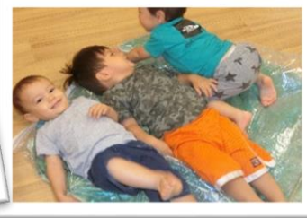
ウォーターベッド!?