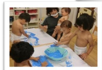
ボディペインティング