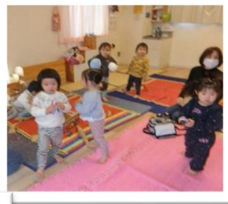
1月の わくわく広場です