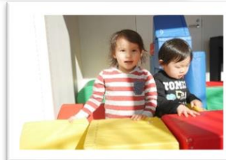
いっしょに いませい