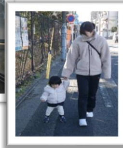
いっしょに あるこう