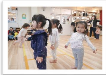
わくわくひろば ～リズムあそび～